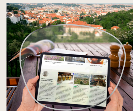
Soczewki jednoogniskowe do blizy

Soczewki VisuPro All Day oferują optymalną korekcję wzroku na wszystkie odległości, dzięki technologii Focus Max Optimization . Technologia ta zapewnia wyraźne i komfortowe widzenie zarówno przy pracy z bliska, jak i podczas korzystania z urządzeń cyfrowych, oferując wyjątkowe wsparcie przez cały dzień.