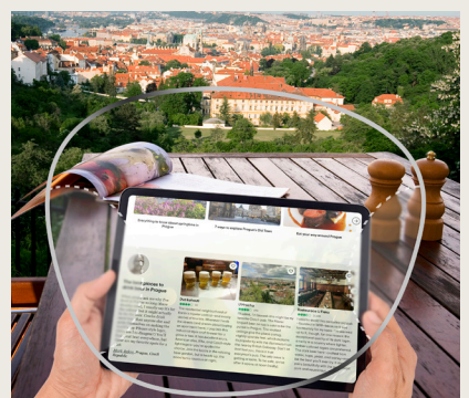
VisuPro All Day

VisuPro Flex zapewnia wyjątkowe wsparcie przy czynnościach wykonywanych z bliska oraz podczas korzystania z urządzeń cyfrowych, jednocześnie korygując wzrok na inne odległości. Dzięki temu zapewnia komfort widzenia podczas noszenia okularów.